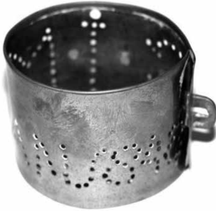
Zwanenhalsband uit de Beemster, 1848, Fries Scheepvaartmuseum

met eene gouden halsband met een wapen, ende de andere een gouden plaatje droeg, met dit opschrift: ik behoer den koning van Denemarken. 20 Ook in 1830 werd een zwaan geschoten: un cygne, tué samedi dernier à Bondeville-Notre-Dame...portait au cou un collier en cuivre avec cette inscription: Baron V. Capelle, Utrecht 21 . Nog in 1912 stond er een annonce: inlichtingen worden beleefd verzocht van twee zwanen waarvan een is voorzien van halsring gemerkt D.d.G. 22 . Het werkte ook in omgekeerde richting, waarbij mensen die een geringde zwaan vonden, een annonce plaatsten: H.H. Zwanehouders die zoeken naar een zwaan, drie à vier Jaren oud, vrouwelijk geslacht, dragende een koperen band, gemerkt letters M. D., met bekmerk ... kunnen tegen vergoeding der kosten inlichtingen bekomen bij P. Boonacker te Groenveld 23 .