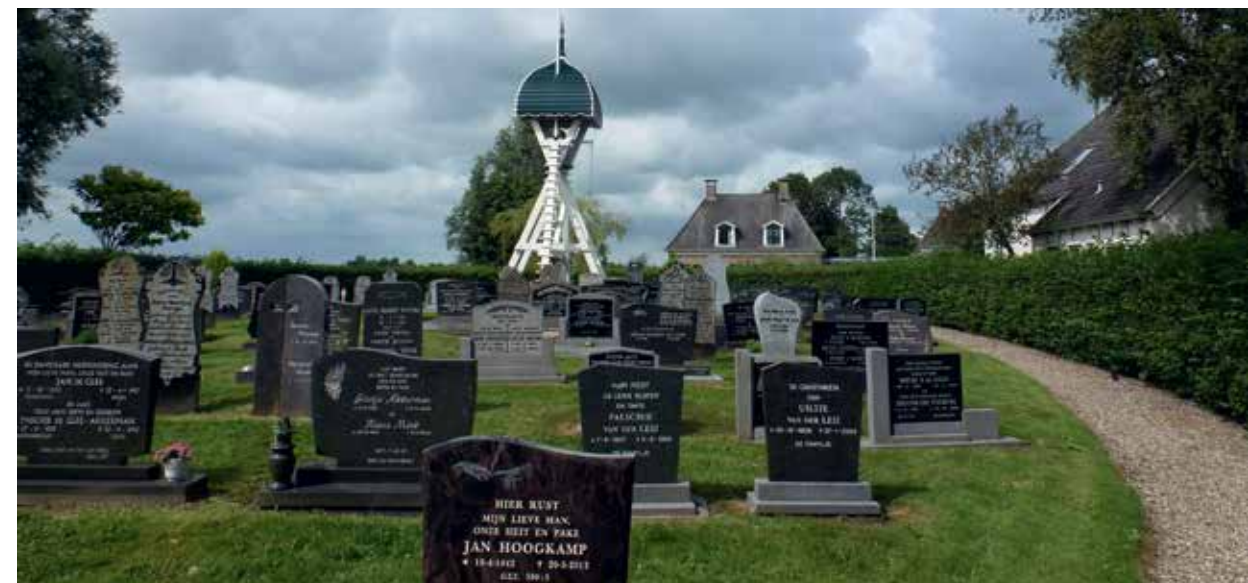
Kerkhof in Broek met het klokhuis.

Zo'n swannekrite kan een behoorlijke afmeting hebben, tot meer dan duizend hectare. Ze is een zakelijk recht voor een begrensde gebied, voor het grootste deel op de gronden en wateren van derden. Die derden mogen de zwanen op hun landerijen niet verstoren of bejagen. Kortom: ze moeten die vogels en hun nesten op hun gronden gedogen. In oude koopcontracten wordt soms melding gemaakt van een zwanenmerk – een eigendomsmerk – of zwanenjacht behorend bij een boerderij of state. Helaas ontbreken vrijwel