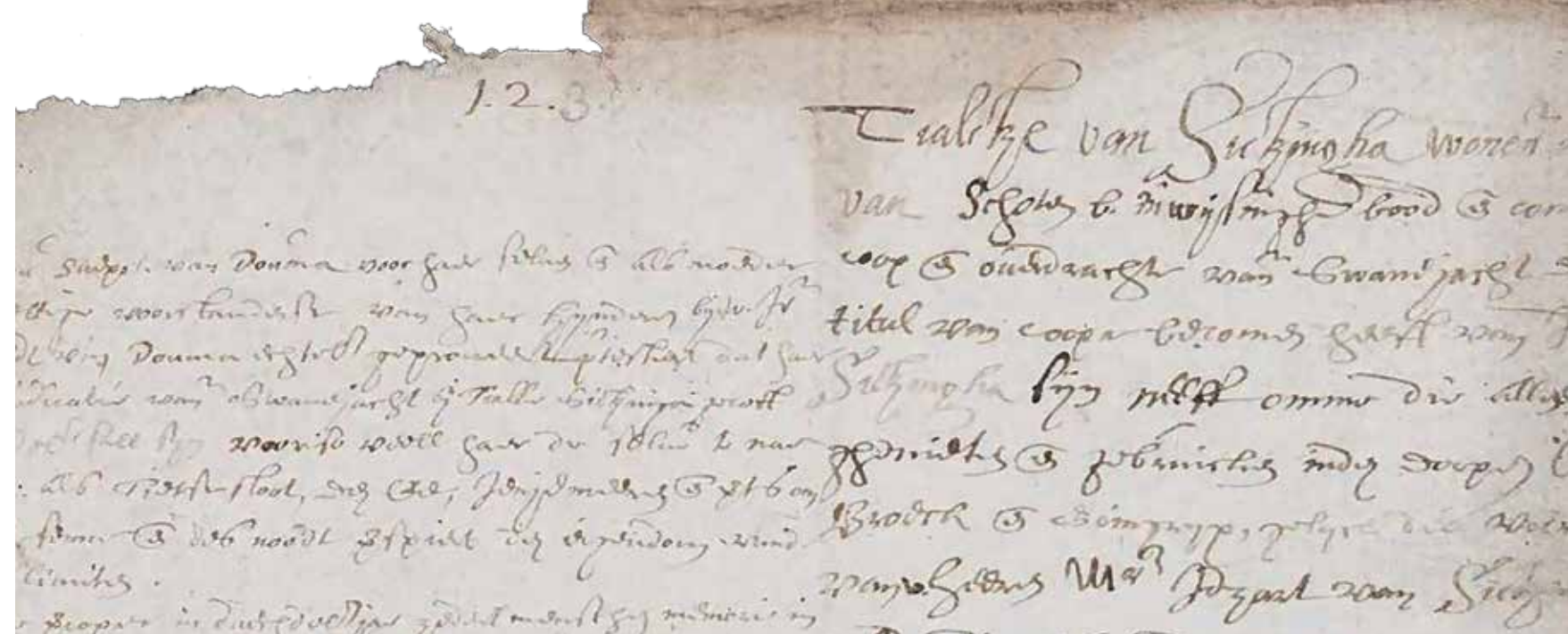
Detail van de koopakte uit 1616, met in de kantlijn erbij geschreven de protesten. (Tresoar)

den dorpe van Ouster Haule door de Zijpen , aan wijlen Sije Jelgers ende voorts aan Tzietse Sloot , of wel de dijck-sloot tot het einde van de Rien , in de olde weij ofte dracht en oock mede in de grote en kleine wielen , de grootste genaamt Haulster-wiel of Boonlands-poel en de kleijne wiel genaamt boonwiel , leggende in den dorpe Ouster Haule voorschreven en alsoo voorts omvarende achter het feenland of boonlandt , in de dolte , langs de famme wiel , brecken , kaj en achter Fokle fenne om de Jeniemeer , en van daar voorts door de watering, door langh-starts-poel , goesse holle en Eesgewiel , Schapewiel , grote en