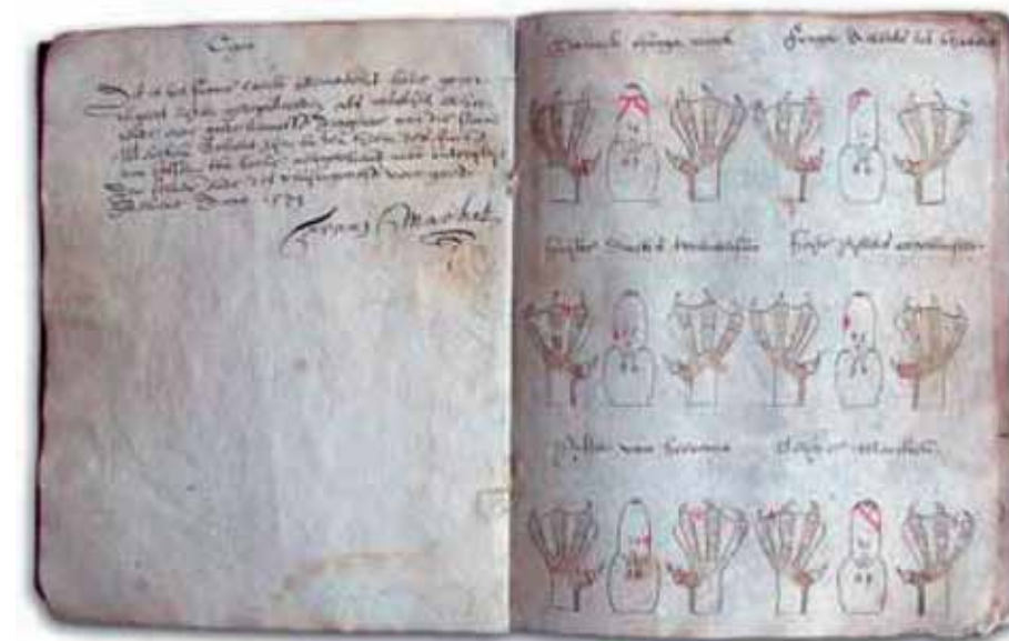
In zwanenboeken staan de namen van de bezitters van het zwanenrecht. Tekeningen van de eigendomskenmerken op poten en snavels laten zien welke zwaan aan wie toebehoort.

cke deze zwanenjacht, gelegen in de dorpen Ouwsterhaule, Broek en Goingarijp, geheel zelf mag genieten en gebruiken. De koopprijs bedraagt 275 carolusgulden, dat nu gelijk staat aan € 4.151,67. De jaarlijkse verplichte levering van twee 'levendige' zwanen wordt kwijtgescholden. Bovenop dit bedrag moet de koper ook nog een band van een hoed leveren, die gegarneerd en gestoffeerd is met tien medailles. Kennelijk is dit een geschenk bij de koop geweest. Helaas wordt in de akte niet de naam van de verkoper genoemd, evenmin aan wie de zwanen niet meer geleverd hoeven te worden. De limieten (grenzen) van de zwanenjacht worden in deze akte omschreven. De vermelde water- en veldnamen zoals die in de akte staan, zijn cursief vermeld. Sommige wateren worden dubbel genoemd, eigen aan het soms rommelige van de akte, en andere namen kunnen vrijwel niet gelezen worden, daar staat een vraagteken tussen haakjes. Niet alle namen kunnen herleid worden naar de tegenwoordige namen.