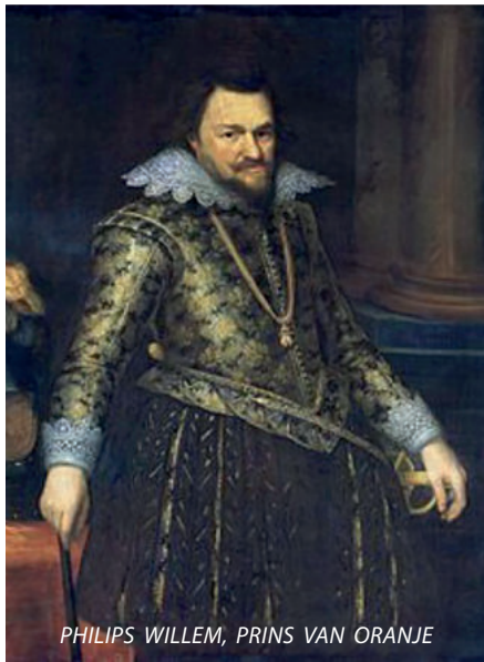
PHILIPS WILLEM, PRINS VAN ORANJE