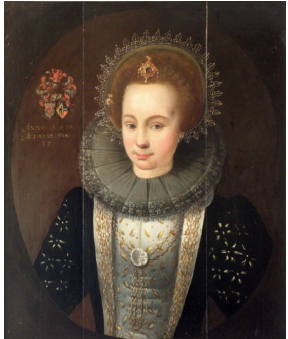
PORTRET LISCK VAN EIJSINGA - ANNO 1611