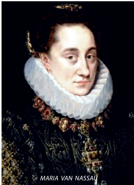
MARIA VAN NASSAU